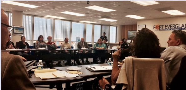
Plenarias de la segunda reunión trimestral con la comunidad empresarial en las instalaciones de Port Everglades.

Las últimas disposiciones en materia del control a la carga con destino e ingreso a los Estados Unidos fue tema central de la segunda reunión trimestral organizada por el puerto de Port Everglades (Fort Lauderdale, Florida) y Autoridades de control con representantes de la industria que manejan cargas de productos perecederos y representantes del sector privado como WBO.